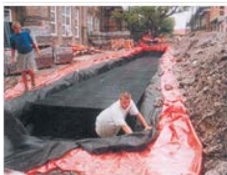
Depósito retención / reciclado,