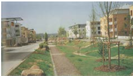
Bulevar de infiltración.

La aparición de publicaciones españolas divulgando experiencias en otros países como el “Manual de Diseño: La Ciudad Sostenible”, así como el desarrollo de normativa local (como la “Ordenanza de Gestión y Uso Eficiente del Agua en la Ciudad de Madrid”), está promoviendo que se adopten estas tecnologías desde la fase de planeamiento.