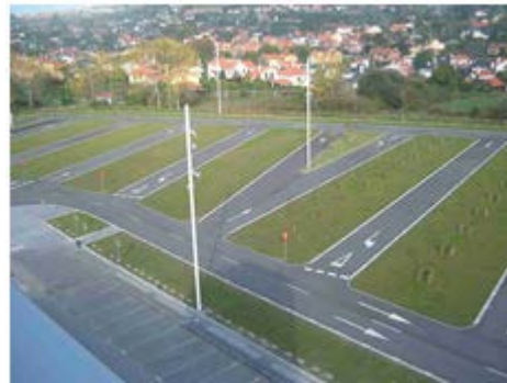
Parking permeable vegetado