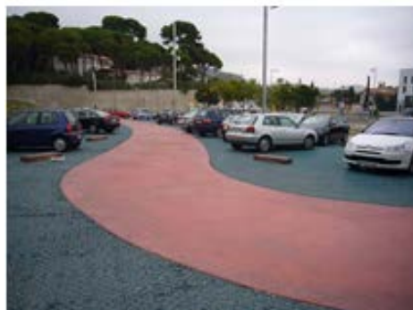
Parking permeable. Adoquín-gravilla